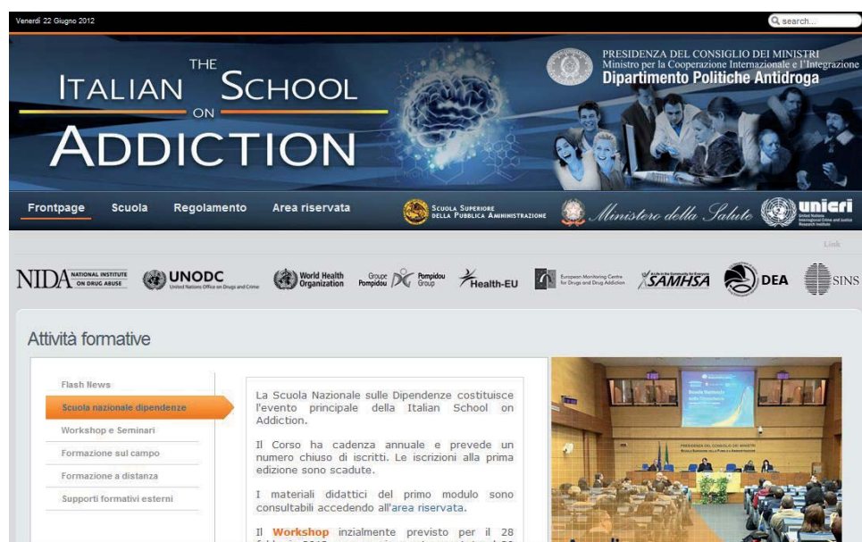
Figura V.5.4: Home page del sito www.dpaschool.it

Sono previste anche altre collaborazioni con il Ministero della Salute, UNICRI, UNODC, EMCDDA e National Institute on Drug Abuse statunitense; quest'ultimo è svolto all'interno dell'accordo di collaborazione scientifica siglato a Roma il 25 luglio 2011.