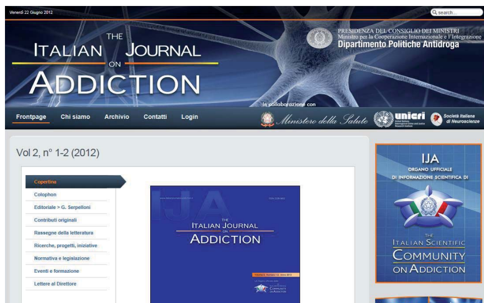
Figura V.5.2: Home page del sito www.italianjournalonaddiction.it

Nell’ambito dell’offerta editoriale a disposizione degli associati è stata costituita una testata periodica a carattere specialistico, pubblicato all’interno della strategia di comunicazione istituzionale del Governo Italiano in materia di tossicodipendenza.