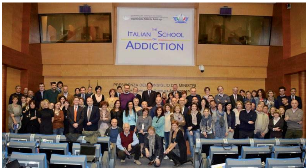
Figura V.5.5: Partecipanti all'edizione 2012 della Scuola Nazionale

Per garantire un ulteriore elemento di qualità delle azioni formative della Scuola, il Dipartimento Politiche Antidroga è stato accreditato come provider sia per le professioni sanitarie (Educazione Continua in Medicina presso il Ministero della Salute) sia per gli assistenti sociali (Consiglio Nazionale dell'Ordine degli Assistenti Sociali). Ne consegue che nel corso del 2012 attraverso la realizzazione degli eventi formativi previsti (corso didattico annuale, workshop, seminari) saranno conferiti oltre 100 crediti formativi.