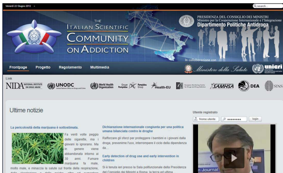
Figura V.5.1: Home page del sito www.dpascientificcommunity.it

Nel corso del 2011, dopo l'attivazione del progetto e quindi degli strumenti informatici previsti, sono state intraprese attività mirate alla promozione dello stesso che hanno prodotto un immediato riscontro di consenso da parte degli operatori di settore che si è concretizzato in una prima "tranche" di iscrizioni distribuiti uniformemente fra gli operatori dei servizi pubblici e quelli del privato sociale, oltre a quote meno rilevanti ma comunque proporzionalmente interessanti fra le Forze dell'Ordine, il mondo Accademico e i liberi professionisti. Dopo essersi consolidata la partecipazione dei primi 500 utenti che hanno aderito all'iniziativa, il trend relativo alle nuove iscrizioni è risultato, nei mesi successivi, in crescita costante.