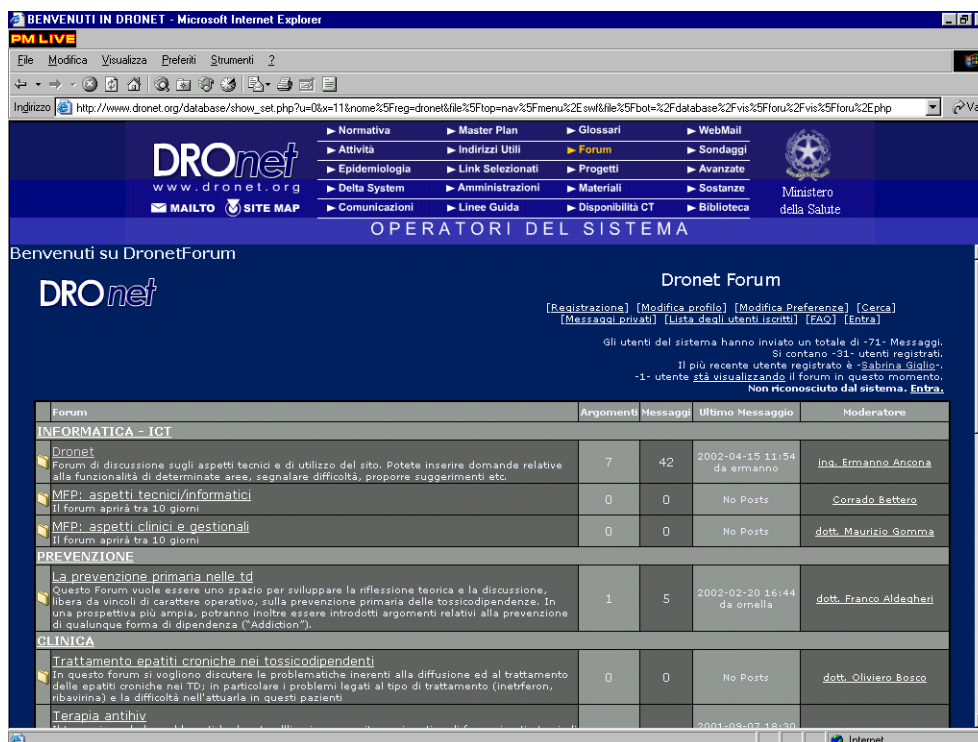
Fig. 2: Area Forum

La pagina che si apre visualizza, all'interno di una tabella, l'elenco degli argomenti di discussione attivi e per ciascuno di essi il numero di messaggi (post) inviati dagli utenti, il mittente dell'ultimo messaggio, il numero di consultazioni che l'argomento ha avuto da parte dei navigatori di dronet, ed infine la data dell'ultimo messaggio.